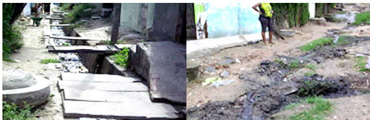
Imagem 08: Canal e esgoto a céu aberto

Cerca de 150 famílias foram deslocadas, no ano de 2008, para bairros circunvizinhos como: Bela Vista, Monte Santo, Jeremias, Centenário, dentre outros para que pudesse ocorrer um trabalho de urbanização, com pavimentação das ruas que estão precárias, reforma do canal que tem mais de 1km (um quilômetro) de extensão e a construção de saneamento básico para o bairro que apresenta esgotos a céu aberto, com córregos cortando as ruas e até casas.